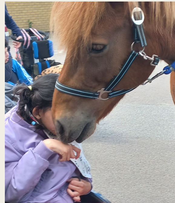
Att få vara nära djur är värdefullt

På flera av Habostiftelsens evenemang och aktiviteter bidrar deltagare från olika dagliga verksamheter. Deltagarna är behjälpliga vid evenemang och har olika sysslor som ger dem en meningsfull vistelse på Habo gård.