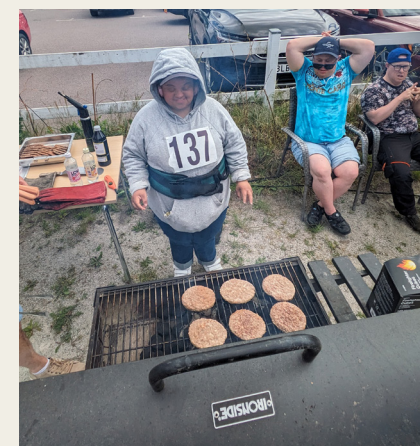
Habogänget grillar på Habogårdsloppet