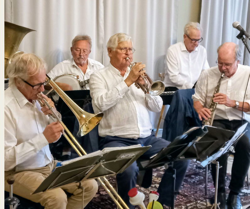
Musikspelning med Fozzez jazzband

Även detta år har Habostiftelsen erbjudit subventionerade utflykter med lunch för grupper från äldreboende, särskilda boende samt seniorboenden och hemtjänstgrupper i Lund. Vårdninnor på Habogård välkomnar och tar hand om grupperna, erbjuder promenad i park och trädgård och passande aktiviteter för säsongen. Projektet initierades 2023 och efterfrågan på utflykterna har alltså ökat.