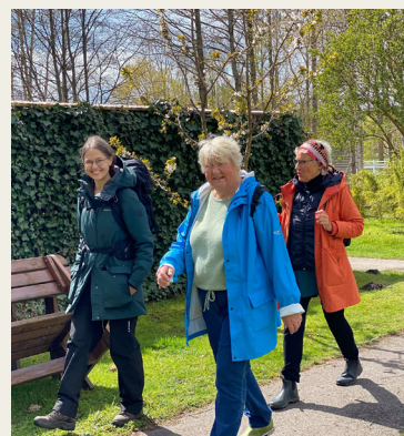
Lunchpromenad med friskvårdsguide