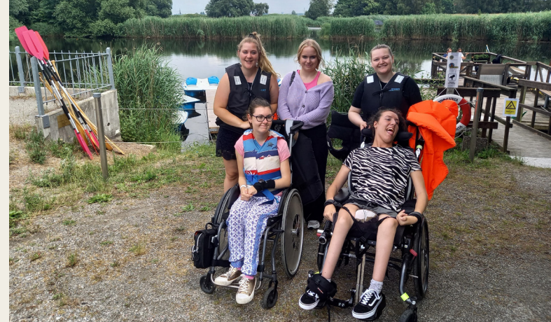
Dagkollo för barn med funktionsnedsättning

Habostiftelsens evenemang har under året haft 4 250 besök